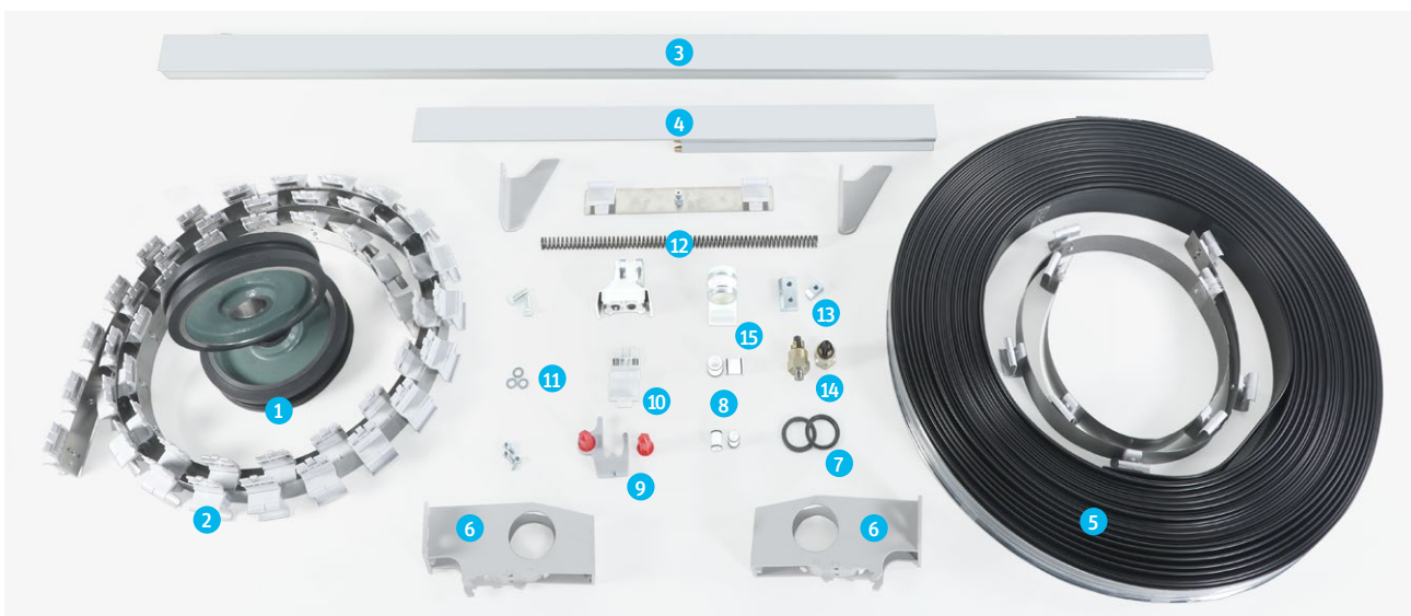
1. Rueda completa 2. Cinta de tracción 3. Perfil de guía 4. Cabezal de perfil de guía 5. Perfil de la cobertura de SERVODisc* 6. Portador de perfil 7. Anillo deslizante 8. Junta 9. Alzaválvulas 10. Arrastrador 11. Sujetadores 12. Resorte de presión 13. Mordaza 14. Pieza de montaje del interruptor de presión 15. Sujetador completo * Perfil de la cobertura de SERVODisc sólo se ofrecerá para un modelo específico de máquina

El kit de mantenimiento del doffer ofrece diversos beneficios. Primero, el tiempo del ciclo de mudada se mantiene constante. Gracias a la mudada rápida y confiable, la máquina se ejecuta de manera sostenible y eficiente. Segundo, el kit de mantenimiento del doffer prolonga la vida útil de la máquina y aumenta la productividad gracias a que ofrece un enfoque de mantenimiento regular y proactivo. También reduce el tiempo de instalación gracias a que viene con piezas preensambladas. Además, minimiza el tiempo de mudada por fugas de aire y reduce la energía. El kit de mantenimiento del doffer consiste de los siguientes componentes principales: