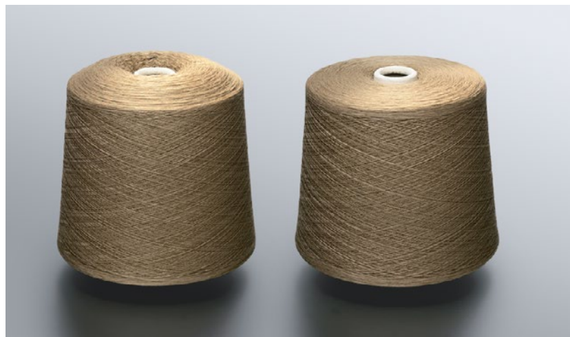
Bobina sem o Variopack FX (lado esquerdo), bobina com o Variopack FX (lado direito)

Tecnologias modernas de sensores, funções de monitoramento e autocalibração, bem como processos inteligentes, foram desenvolvidos e integrados à Autoconer para serem mais suaves, mais eficientes, mais precisos e mais flexíveis. Essa solução atende às crescentes demandas do segmento de lã com relação à qualidade, flexibilidade, sustentabilidade e independência do operador.