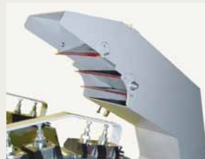
Caixa de aspiração com limpadores flexíveis