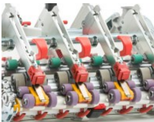
EliTe®倚丽特紧密纺装置升级版

https://rieter.picturepark.com/Website/?AssetId=82357