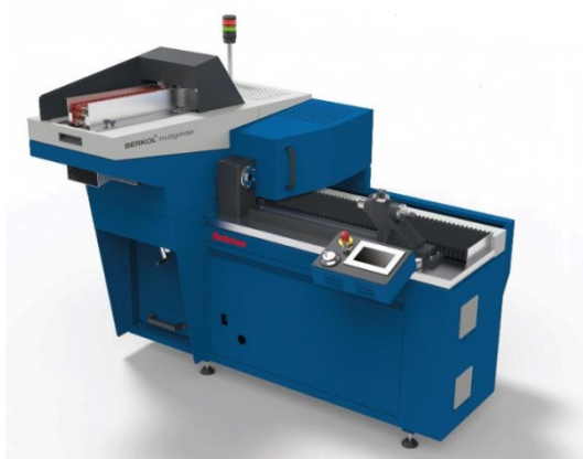
Berkol®贝克多功能磨皮辊机 MGL

https://rieter.picturepark.com/Website/?AssetId=69537