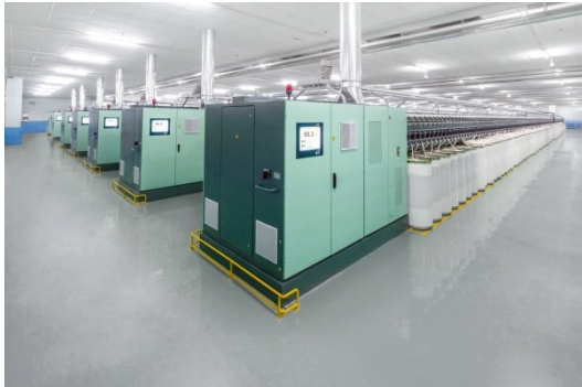
Rotorspinmaschine R 36

https://rieter.picturepark.com/Website/?AssetId=69537