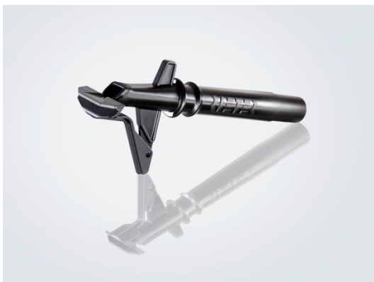
Suction tube ECOrized

https://rieter.picturepark.com/Website/?AssetId=75169