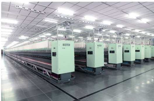
Kompaktspinnmaschine K 42

https://rieter.picturepark.com/Website/?AssetId=79477