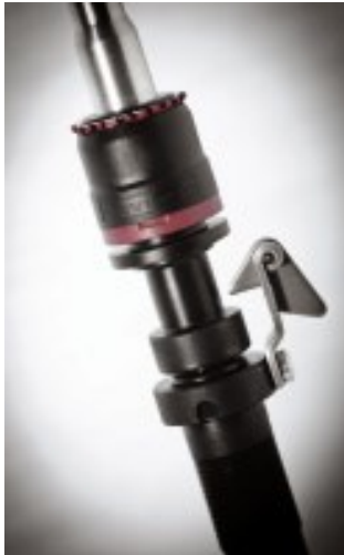
LENA with CROCOdoff

https://rieter.picturepark.com/Website/?AssetId=82294