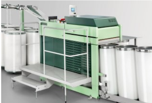
Strecke RSB-D 50

https://rieter.picturepark.com/Website/?AssetId=79477