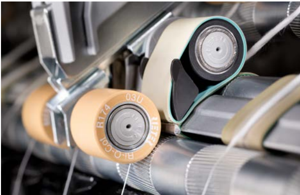
Ring iplik makinalarında kullanılan Q-Package

Q-Package sayesinde, iğ dönüş hızı, IPI değerlerini ve tüylülüğü etkilemeksizin maksimum devir/dak. limitlerinde %10'a varan oranda arttırılabilir. Verimlilik artarken kalite değişmeden kalır.