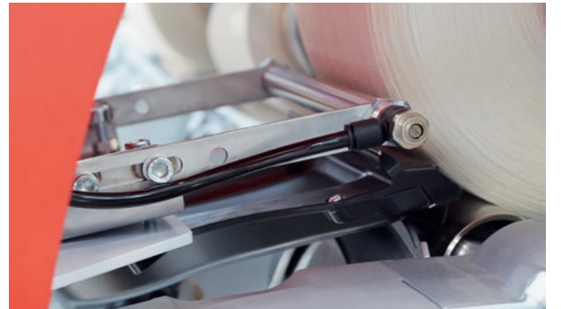
Doferdeki (takım deđiřtiricideki) Smartjet güç düzesi, üst iplik ucu arama işleminin başarı oranını daha da yükseltir.