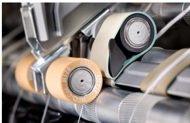
Paquete Q en máquinas de hilar a anillos

El paquete Q permite aumentar el número de revoluciones del huso hasta en un 10%, dentro del límite máximo de revoluciones, sin que se vean afectados los valores de IPI ni la velocidad. Esto se traduce en un incremento de la productividad sin ningún cambio en la calidad.