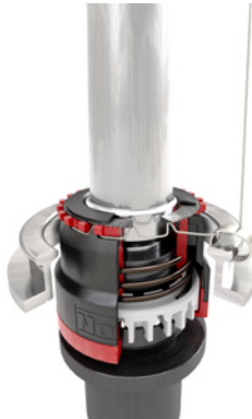
İğ durdurulur, İplik sıkıştırılır, Kops çıkarılır, İplik kesilir.