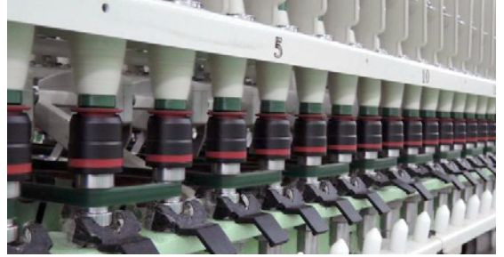
Alt sarımsız taçlar