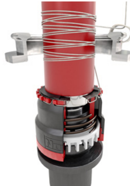
Boş masura takılır, İplik sıkıştırılır, İğ başlatılır.