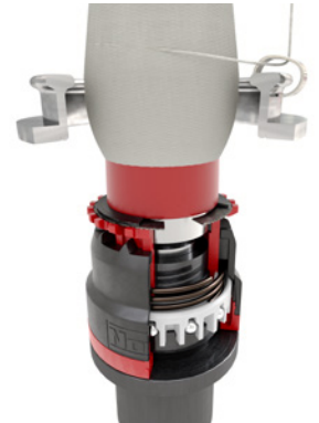
Eğirme işlemi yapılır, İplik serbest bırakılır, İplik ucu sistemden uçar.