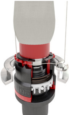
Kops biter, Geri sarım yapılır, İplik yerleştirilir.