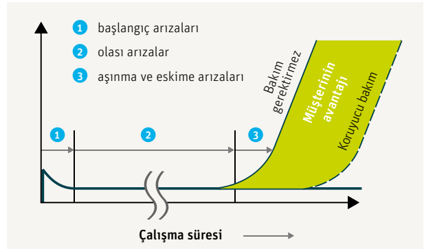
Özgün bakım kavramları

Bölgemizdeki mevcut ürün yelpazesi hakkında bilgi almak için lütfen satış sonrası temsilcinizle görüşün.