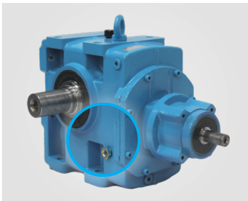
维修前齿轮箱上使用了1.8升的油位指示器

新的油位指示器可帮助技术人员快速查看油质，检查齿轮箱内的油量是否充足(推荐量为3升)。